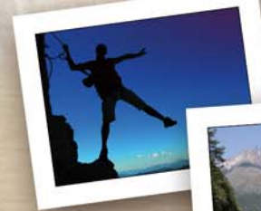
Via - Ferrata